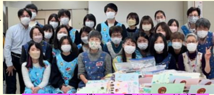
マスクはずして、見せたい笑顔

新型コロナウイルス感染症が世界中で大流行して3年目。病院内での対面活動は、現在も休止のままで。今年も院内のレストランでの交流会も全て中止でした。少しずつ感染対策にも慣れて、スタッフとボランティアでクリスマスカード作成を公的施設をお借りして実施しました。いつものように感染対策を充分にとりながらの4日間でした。のべ95名の参加があり、おかげさまで150枚を超えるすてきなカードができました。